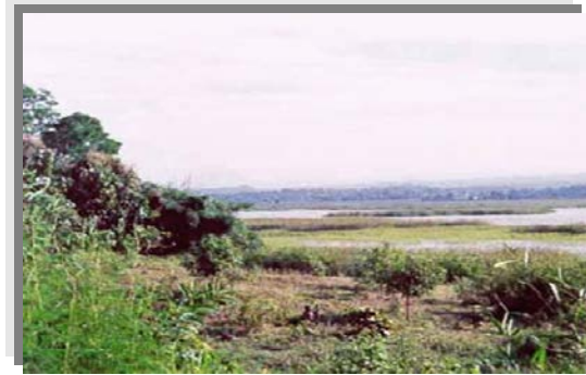
บริเวณที่พบ

ลักษณะโดยทั่วไป : เนื้อดินเป็นพวกดินเหนียว ดินบนมีสีเทาแก่ น้ำตาลปนเทา ดินล่างมีสีเทาอ่อนหรือสีเทา มีจุดประสีน้ำตาลแก่และน้ำตาลปนเหลือง ตลอดชั้นดินมักพบก้อนสารเคมี เหล็กและแมงกานีสปะปนอยู่ในพื้นที่ปลูกของไม้ผลแต่ละชนิดชั้นดินลึกดินกลุ่มดินนี้ เกิดจากพวกตะกอนลำนํ้า และเป็นดินลึก มีการระบายน้ำแลพบในพื้นที่ ราบเรียบตามลานตะพักลำนํ้าค่อนข้างใหม่ และลานตะพักลำนํ้าระดับต่ำ น้ำแข็งลึกลงน้อยกว่า 30 ซม. นาน 3-5 เดือน ดินมีความอุดมสมบูรณ์ตามธรรมชาติค่อนข้างต่ำถึงปานกลาง pH 5.5-6.5 แต่ถ้าดินมีก้อนปูนปะปนในดินชั้นล่าง ดินชั้นนี้จะมีปฏิกิริยาเป็นด่างอ่อน pH 7.5-8.0 ได้แก่ ชุดดินหางดง และ พาน ปัจจุบันบริเวณดังกล่าวส่วนใหญ่ใช้ทำนา ในบริเวณที่มีแหล่งน้ำใช้ปลูกพืชไร่ พืชผัก และยาสูบในช่วงฤดูแล้ง ข้าวที่ปลูกโดยมากให้ผลผลิตค่อนข้างสูง